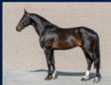
Quando van de Helle, Quibery x Chicago Z