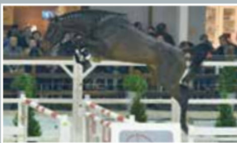
El Barone 111 Z