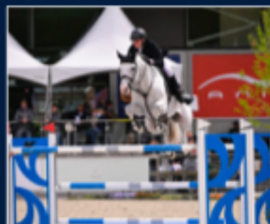
Casillas van de Helle, Casall x Corrado I