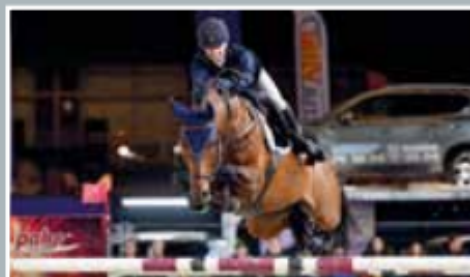
Uncanto Di Villagana

Roshoeve is een hengsten- en handelstal. Wij bieden een ruim gamma aan hengsten aan voor onze fokkers. Verder kan u ook bij ons terecht voor aan- of verkoop van talentvolle sportpaarden.